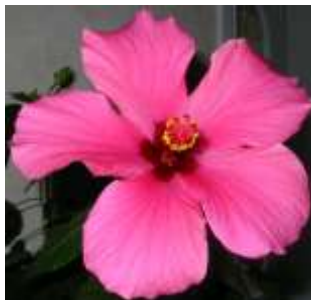
Image recadrée par une sélection rectangulaire